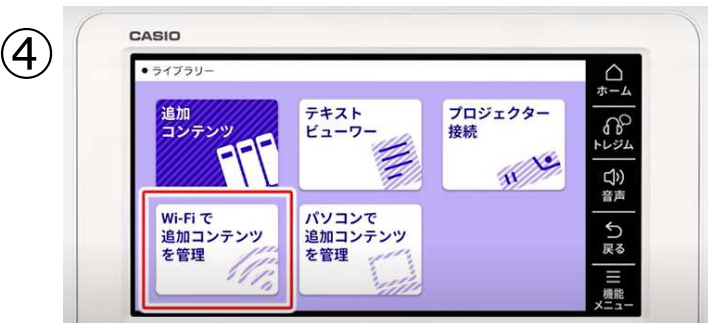
④ 『Wi-Fiで追加コンテンツを管理』をタッチ