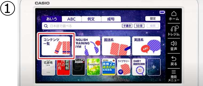
① ホーム画面から『コンテンツ一覧』をタッチ