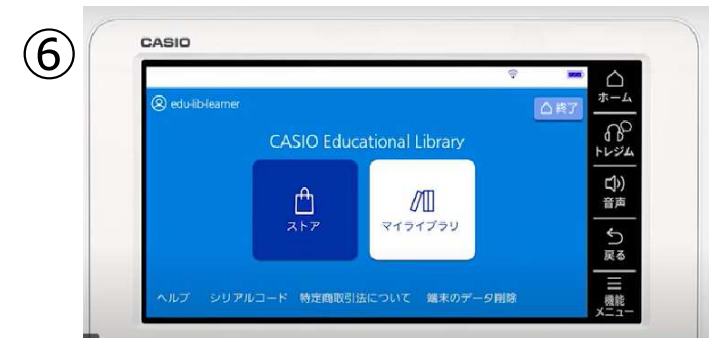
⑥ [casio educational library] 『マイライブラリー』をタッチ