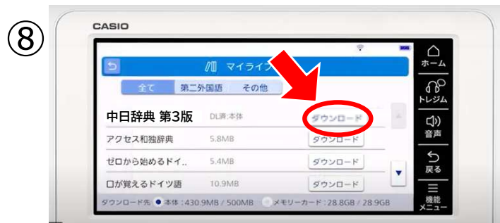
⑧ 再度、『ダウンロードマーク』をタッチ 更新完了