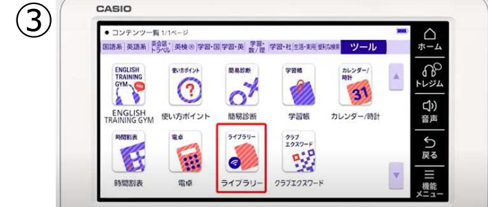
③ 『ライブラリー』をタッチ